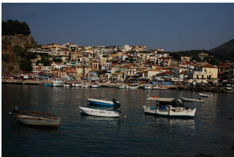
Parga, Epir, Grčka