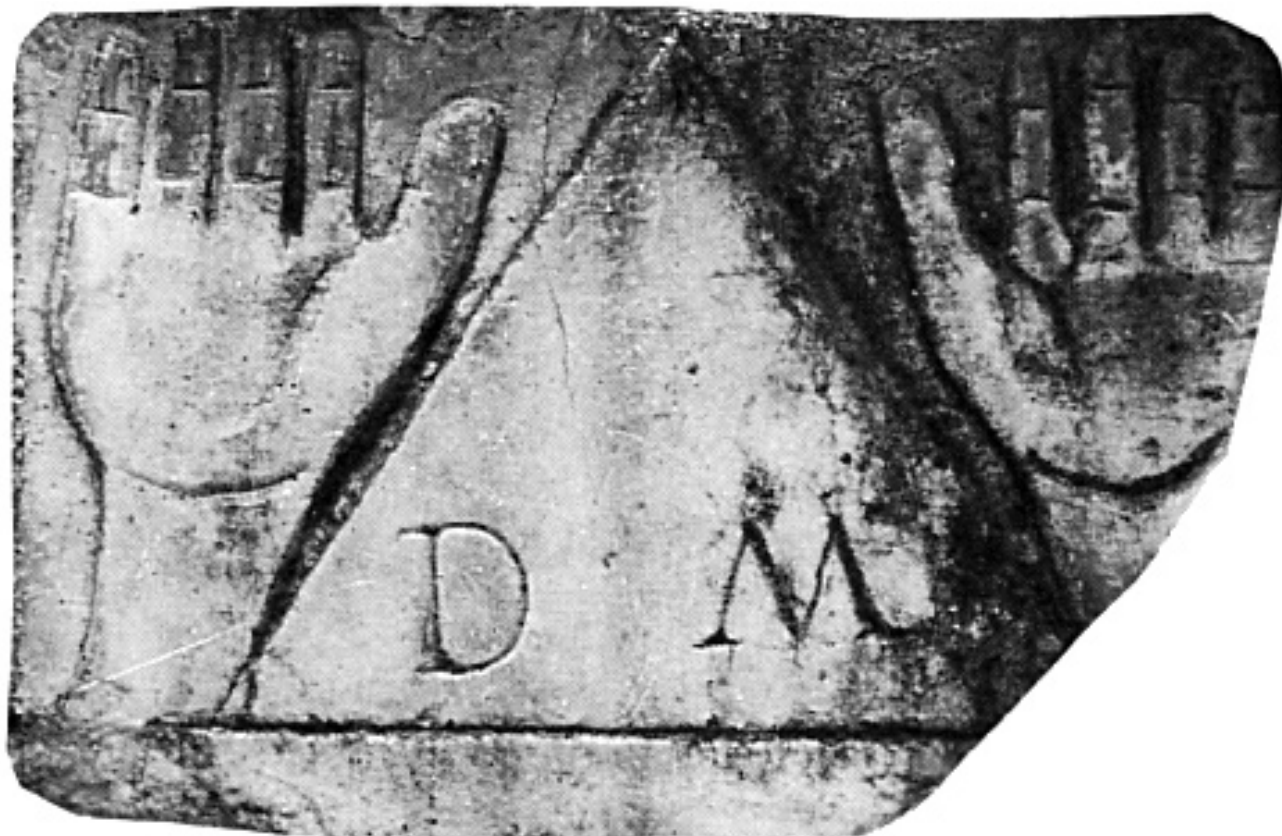
FIG. 3 DISPERSO, GIÀ BUTTRIO, VILLA DI TOPPO-FLORIO: CORONAMENTO DI STELE.

così designata e della sua conoscenza del greco 47 . La tipicità di tale desinenza è confermata anche dal fenomeno dei falsi signa , che cominciano a diffondersi a partire dal IV sec., i quali sono in realtà ricavati dal cognome del defunto suffissato in -ius che al vocativo viene segnato con la doppia -ii (in AE 1968, 115 il falso signum di Audentius Aemilianus è Aemilianii ) 48 .