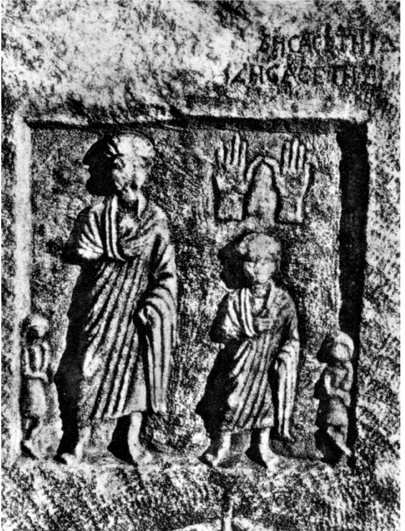
FIG. 4 ISTANBUL. MUSEO ARCHEOLOGICO (INV. NR. 4252): FRONTE DI SARCOFAGO. PARTICOLARE DELLA DECORAZIONE.