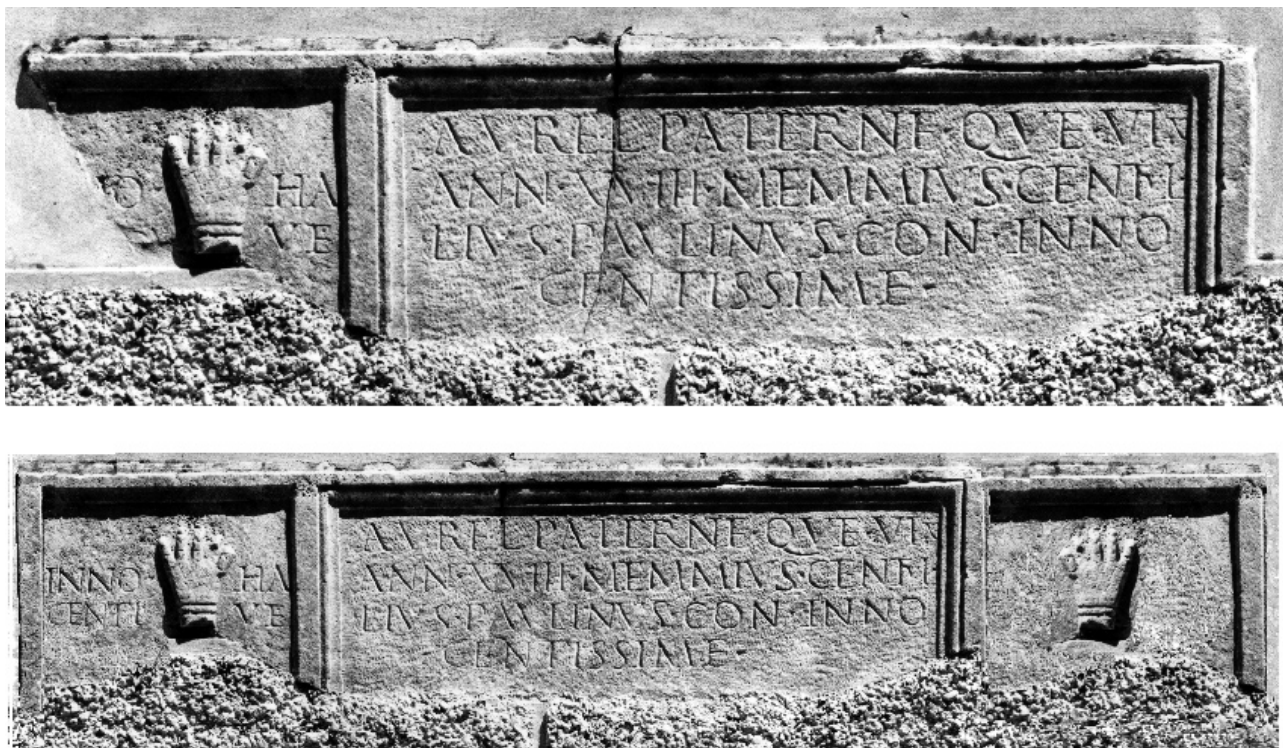
FIG. 1, A-B BUTTRIO, VILLA DI TOPPO-FLORIO: A) FRONTE DI SARCOFAGO CON IL MOTIVO DELLE “MANI ALZATE” (NR. DI COLLEZIONE 113). B) RICOSTRUZIONE DIGITALE DELLO STESSO A CURA DI F. MAINARDIS.

Rimane unicamente una tabula rettangolare iscritta, incorniciata da un listello piatto, leggermente più largo di lato, e da una gola rovescia, che la separano, a sinistra di chi guarda, da un riquadro verticale, delimitato in alto da un listello piatto e da un cavetto, e lungo il lato sinistro da una gola rovescia, della quale rimane appena un resto. Il riquadro racchiude un'altra iscrizione e la raffigurazione a rilievo di una mano destra rivolta verso l'osservatore, come si può dedurre dalle brevi incisioni sulle dita, e da quelle che si incrociano obliquamente ad imitare le linee tipiche del palmo delle mani. Altre due incisioni orizzontali e parallele si trovano all'altezza del polso 5 , al di sotto del quale si notano ancora resti di rilievo. Si richiama, infine, l'attenzione alla presenza, lungo il margine superiore, di un listello rilevato e leg-