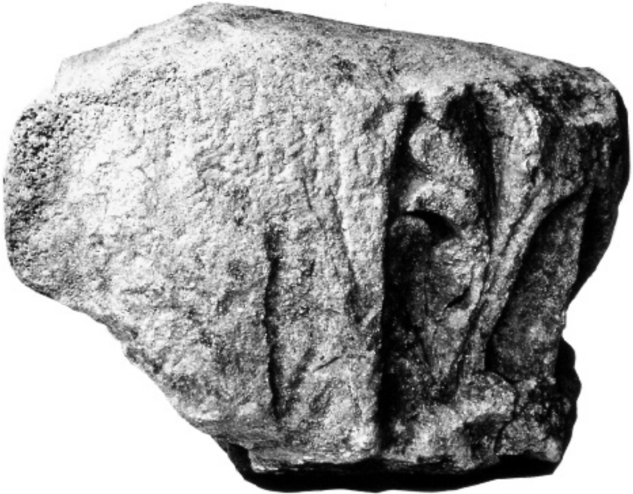
ABB. 2 BADENWEILER. RELIEFBLOCK MIT AKANTHUSRANKEN, GEFUNDEN 1894 BEIM BAU DER KIRCHE.

(Höhe: max. 69,70 cm; Breite: noch 28,70 cm; Tiefe: max. 56,90 cm)