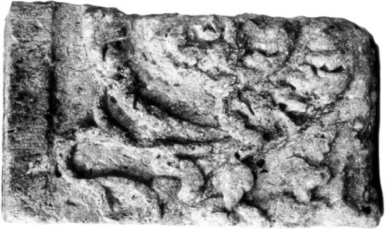
ABB. 1 BADENWEILER. ALTAR- ODER SOCKELFRAGMENT, GEFUNDEN 1894 BEIM BAU DER KIRCHE.

Querformatiger Reliefblock (Abb. 1) mit breitem, linksseitigem Randschlag, über Eck bearbeitet: