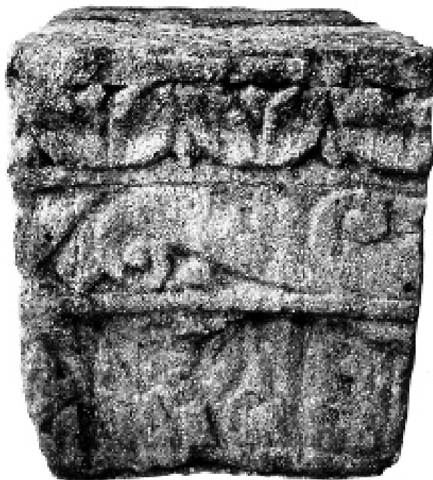
ABB. 3 BADENWEILER. BOGENFRAGMENT - ANSICHT, GEFUNDEN 1894 BEIM BAU DER KIRCHE.

(Höhe: max. noch 39 cm; Breite: noch 35 cm; Tiefe: max. noch 64 cm)