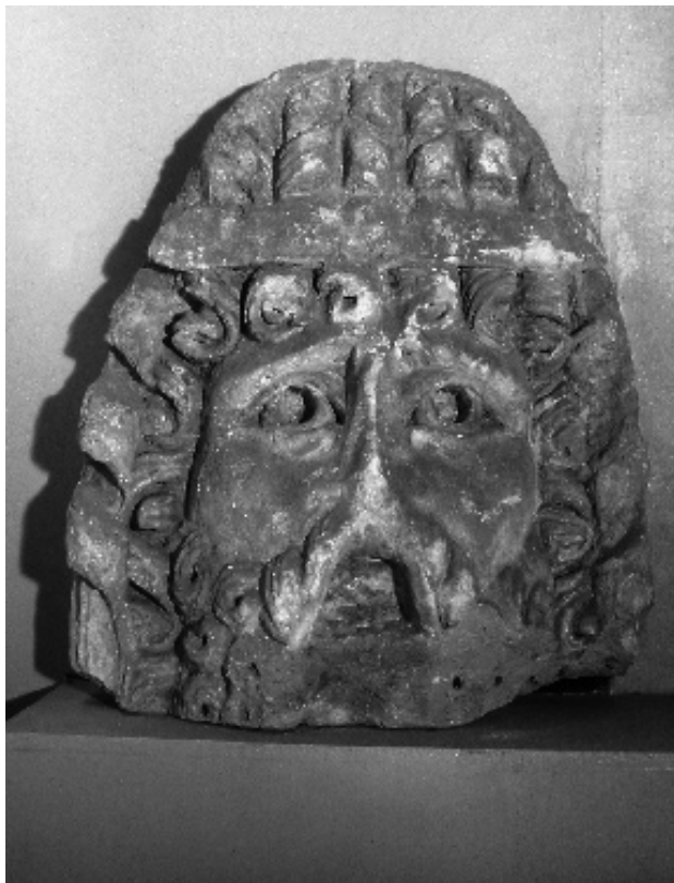
FIG. 2 MASQUE TRAGIQUE DE NASIUM; H. 0,84 M.; MUSÉE DE BAR-LE-DUC.

dans les archives où ils sommeillaient 8 : ils nous éclairent sur le contexte de la découverte et contredisent, sur bien des points, le travail de F. Liénard. Les sculptures ont été exhumées, en réalité, en 1845, lors du creusement du canal de la Marne au Rhin; contrairement à ce qu'écrivait l'archéologue meusien, elles n'ont pas été retrouvées en remploi dans une construction tardive, mais dans les vestiges d'un bâtiment qu'il est permis d'identifier comme une tombe monumentale d'époque romaine.