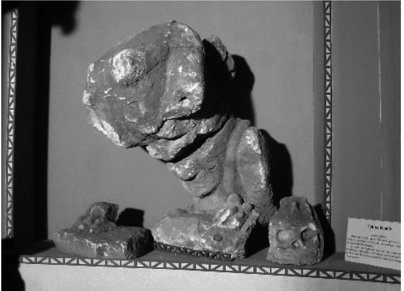
FIG. 1 SPHINX DE NASIUM ; H. 0,66 M.; MUSÉE DE BAR-LE-DUC.