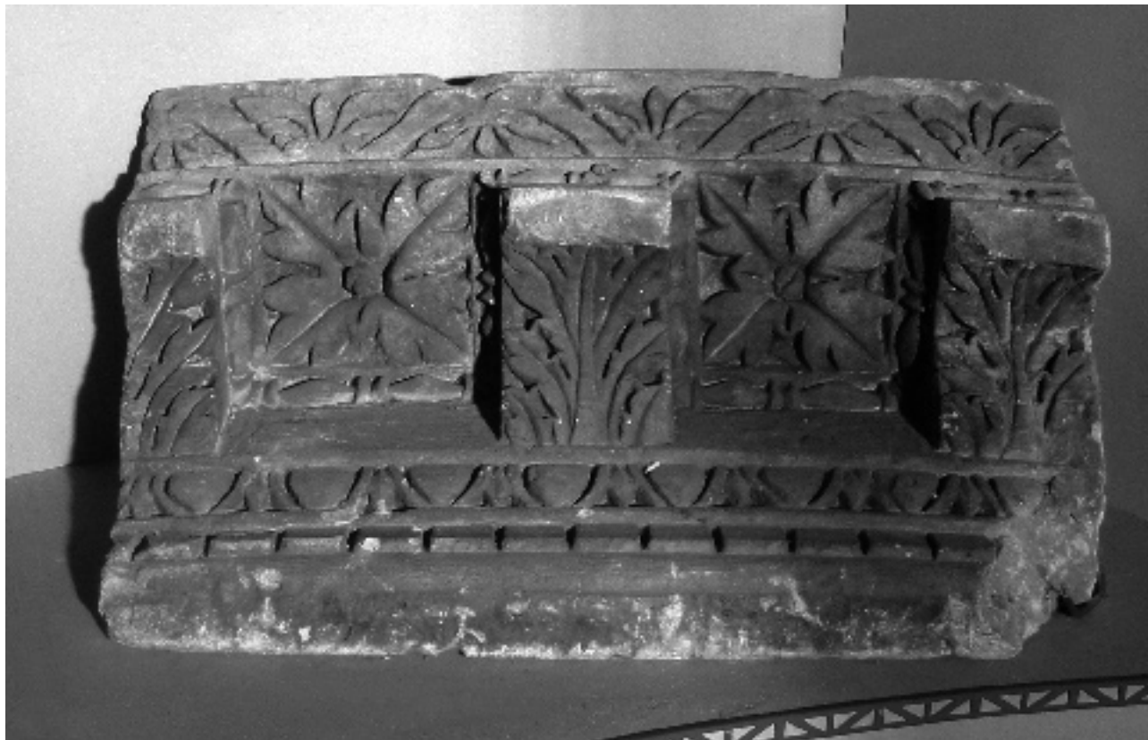
FIG. 3 BLOC D'ENTABLEMENT DE LA TOMBE MONUMENTALE DE NASIUM ; LG. 0,86 M.; MUSÉE DE BAR-LE-DUC.