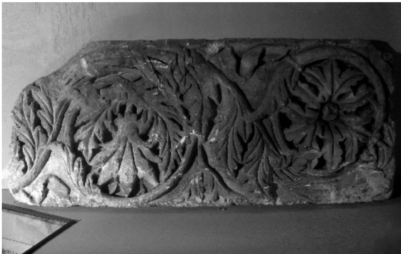
FIG. 4 FRAGMENT DE LA FRISE DE RINCEAUX DE LA TOMBE MONUMENTALE DE NASIUM ; H. 0,52 M., LG. 1,21 M.; MUSÉE DE BAR-LE-DUC.