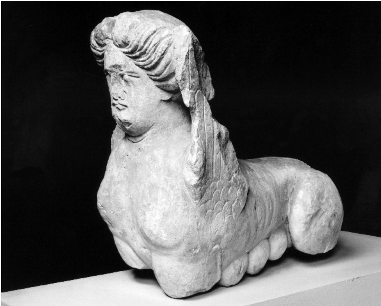
FIG. 4 SPHINXE DÉCOUVERTE À NANTES (CLICHÉ C. HÉMON, MUSÉE DÉPARTEMENTAUX DE LA LOIRE-ATLANTIQUE).

mière indication : même si le décor des édifices funéraires gallo-romains est traité de manière très différente de celui des cuves de sarcophages 25 , il est très tentant d'envisager un certain parallélisme et une signification voisine, sinon tout à fait identique. Mais tout l'édifice ne baignait pas dans une atmosphère mythologique : le panneau de gladiateurs constitue au contraire une notation très concrète, renvoyant à une réalité contemporaine du monument, et immédiatement compréhensible par l'observateur. À n'en pas douter, la vignette con-