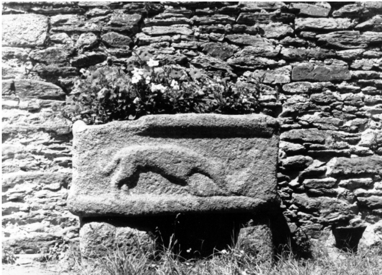
FIG. 5 PROBABLE COFFRE À URNES DÉCOUVERT À PLOUMOGUER (OSISMES).

ment attesté depuis l'Égypte de l'Ancien Empire jusqu'à Rome. Son extension à la Gaule romaine ne doit donc pas nous étonner même si le nombre d'exemplaires signalés reste peu important 33 . Quatre furent retirés à Nantes des fondations de l'enceinte tardive ; deux sont conservés. Il s'agit plus exactement de deux sphinges qui ont été taillées dans un tuffeau du Val de Loire. Elles sont de dimensions identiques (H. conservée : 0,60 m ; L : 0,70 m ; l : 0,31 m) et veillaient certainement sur la même tombe monumentale. La mieux conservée (fig. 4) comprend un buste de femme surmonté d'une tête large à la coiffure abondante, deux petites ailes remontant de chaque côté jusqu'à la tête et un corps ani-