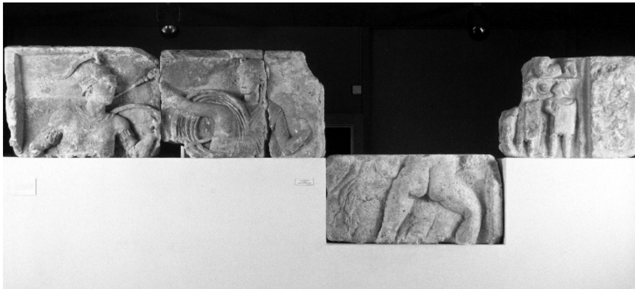
FIG. 3 VESTIGES D'UNE STÈLE MONUMENTALE DE NANTES. LES TROIS BLOCS SITUÉS À GAUCHE SE RATTACHENT À LA MÊME SCÈNE (UNE AMAZONOMACHIE) ORNANT LA FACE ANTÉRIEURE ; LE BLOC DE DROITE, PORTANT DEUX GLADIATEURS, APPARTENAIT À LA FACE POSTÉRIEURE DU MONUMENT.