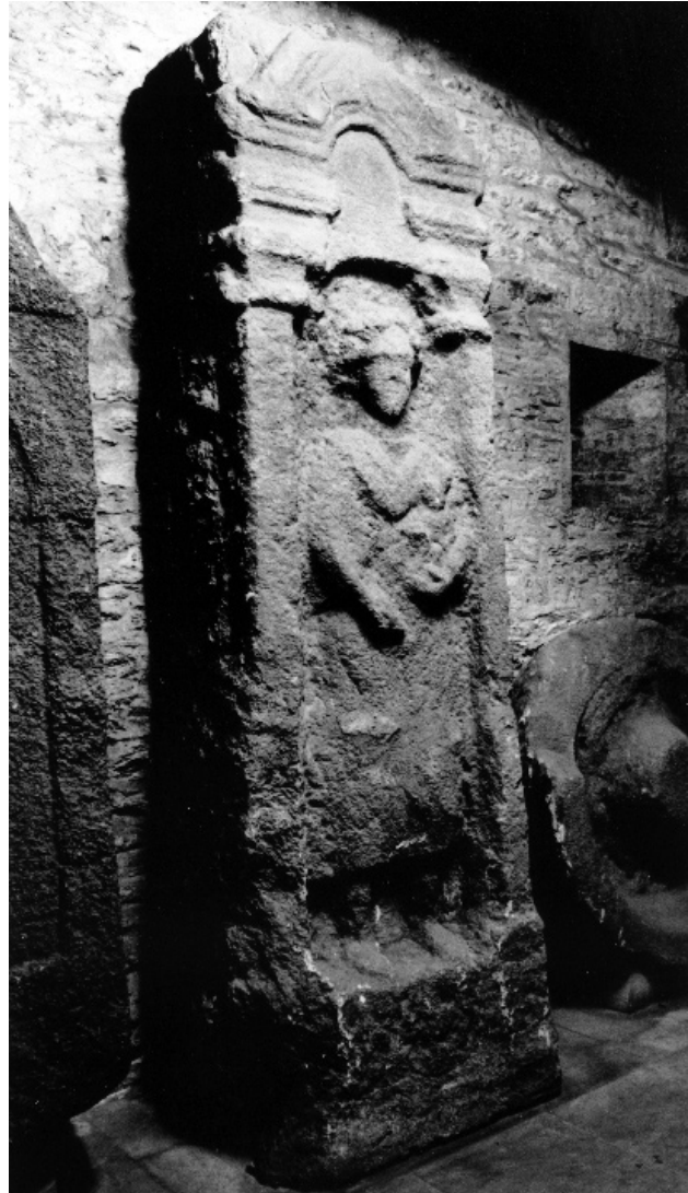
FIG. 2 STÈLE FUNÉRAIRE DÉCOUVERTE À NANTES (CLICHÉ C. HÉMON, MUSÉE DÉPARTEMENTAUX DE LA LOIRE-ATLANTIQUE).

tout cas le seul dédicataire dont l'activité professionnelle soit mentionnée. Les formulaires utilisés permettent de dater ces monuments entre la période flavienne et le milieu du III e siècle de notre ère.