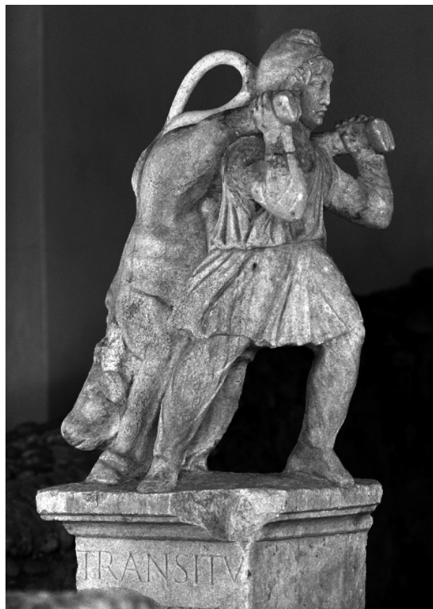
ABB. 3 STATUE DES MITHRA TRANSITUS AUS DEM I. MITHRÄUM IN SPODNJA HAJDINA.

Poetovio hatte in seiner Blütezeit sehr viele Bewohner aus den verschiedensten Teilen des Römischen Reiches. Trotzdem sind auf den Steindenkmälern meist die Gottheiten der offiziellen römischen Religion, hauptsächlich der oberste Gott Iuppiter, genannt bzw. dargestellt. Charakteristisch für Poetovio ist, dass der Glaube an die alten keltischen Gottheiten, vor allem der an die keltischen 'erhabenen Ammen', die Nutrices Augustae , auf deren Reliefs Frauen beim Kult gezeigt werden, nicht untergegangen ist; die Männer, die Soldaten, Kaufleute und Beamten, haben sich dagegen in den Tempeln des Gottes Mithras versammelt. Von anderen Gottheiten gibt es meistens nur einzelne Erwähnungen bzw. Darstellungen (Abb. 4).