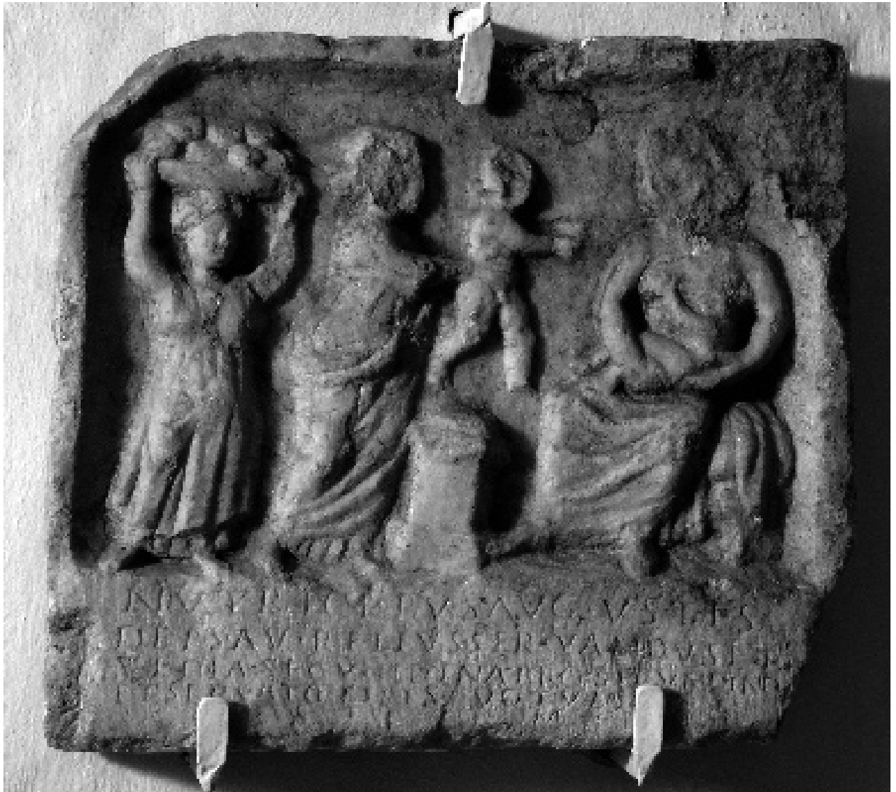
ABB. 1 WEIHRELIEF MIT DARSTELLUNG DER NUTRICES AUGUSTAE.

doppelt geschwungenen norisch-pannonischen Volutenornament gerahmt wird, die Weihinschrift. Der Sockel des Altares ist mit einem Kreisornament mit innen liegender Rosette verziert und an den Rändern mit Halbkreisen.