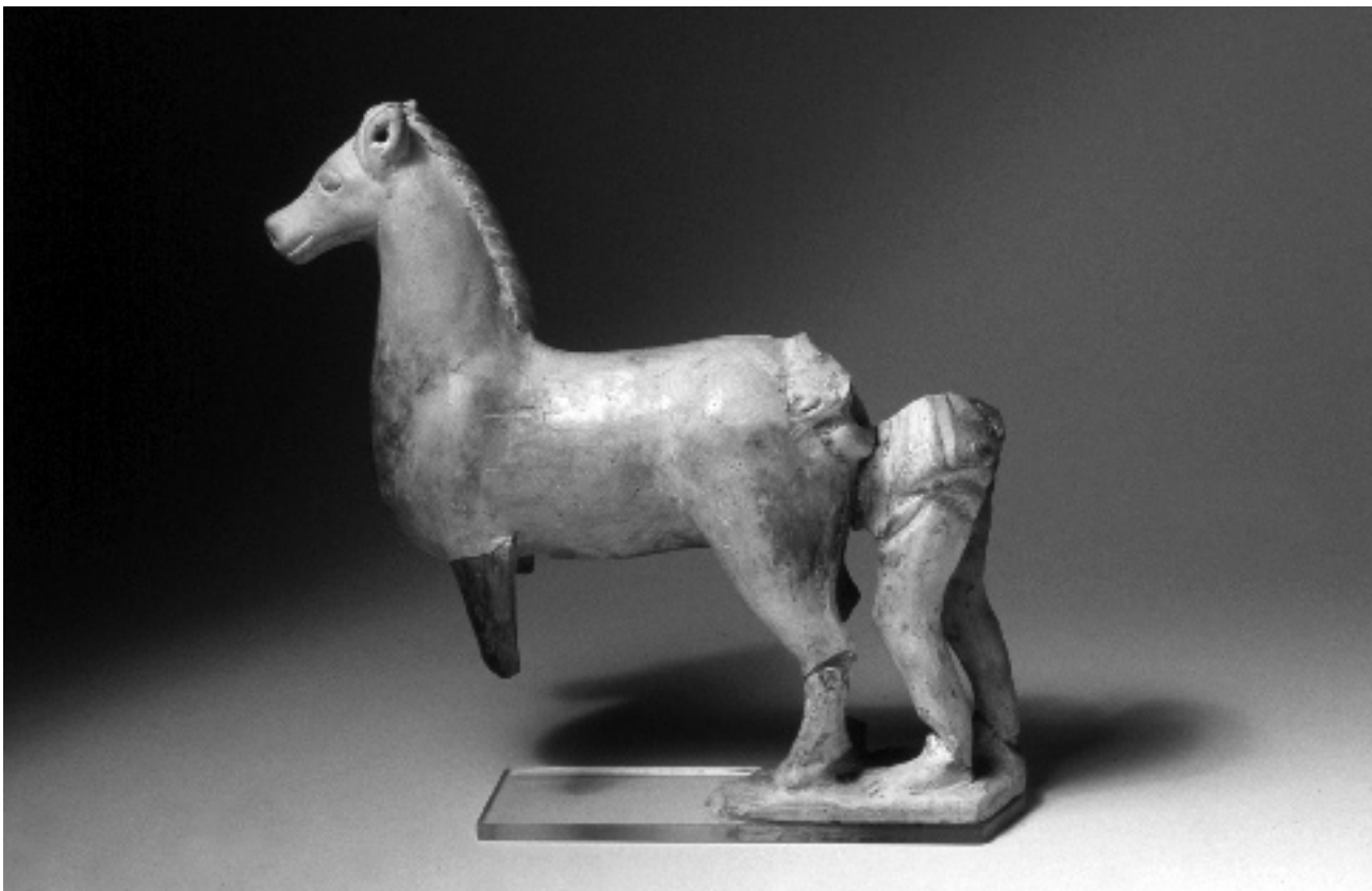
ABB. 3 AUGST, LINKE GESAMTANSICHT DER FIGUREN-GRUPPE, DUNKLE RUSSSPUREN AM LINKEN VORDERBEIN.