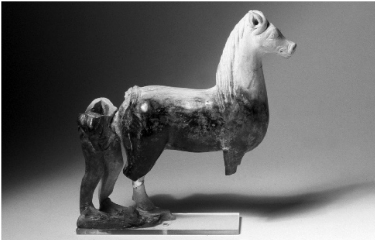
ABB. 5 AUGST, RECHTE GESAMTANSICHT DER FIGURENGRUPPE, MIT SICHTBAREN DUNKLEN SPUREN AM UNTERKÖRPER VOM RUSS DER BRANDSCHICHT, AUS DER SIE GEHOBEN WURDE.