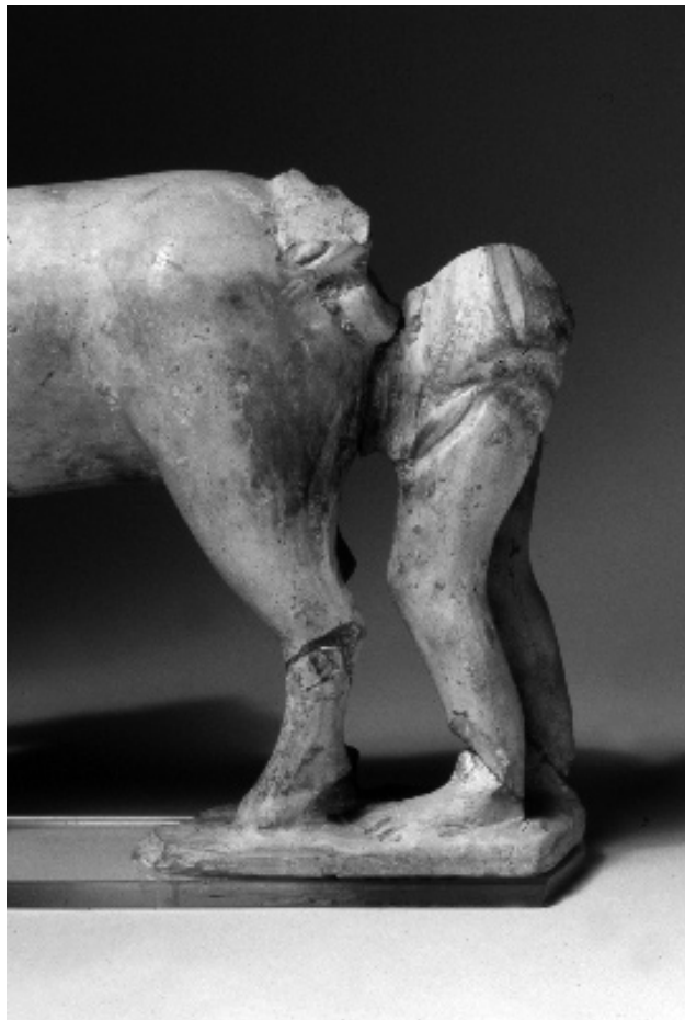
ABB. 6 AUGST. DETAIL DER FIGURENGRUPPE, GEMEINSAM STEHEND AUF EINER STANDPLATTE, WOBEI DER MANN IM BEGRIFF IST, MIT SEINER LINKEN HAND DEN STUTENSCHWANZ FEST AN IHRE LINKE HÜFTSEITE ZU DRÜCKEN.

Stute fehlen nur die beiden Vorderbeine bis zum Oberschenkel sowie beim rechten Hinterbein der Unterschenkel, wobei der dazugehörige Huf auf der Standplatte haftend erhalten ist. Die Stute steht dabei mit leicht angehobenem Kopf, die Ohren anliegend nach hinten gerichtet, auf dem vorgestellten linken Hinterbein. Die Ohren sind durchlässig und haben mit dem Loch zwischen den Hinterbeinen eine technische Funktion beim Brennen.