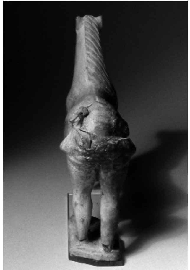
ABB. 4 AUGST, DETAIL DER FIGURENGRUPPE, RÜCKANSICHT DES MANNES UND DES STUTENKOPFES.

Der Erhaltungszustand der Stute (Gonzenbach: Typ Pferd, Taf. 106, 1 (1986); Gruppe 1, Abb. 94,2 und 4 (1995)) 7 ist bedeutend besser als der des Mannes. Bei der