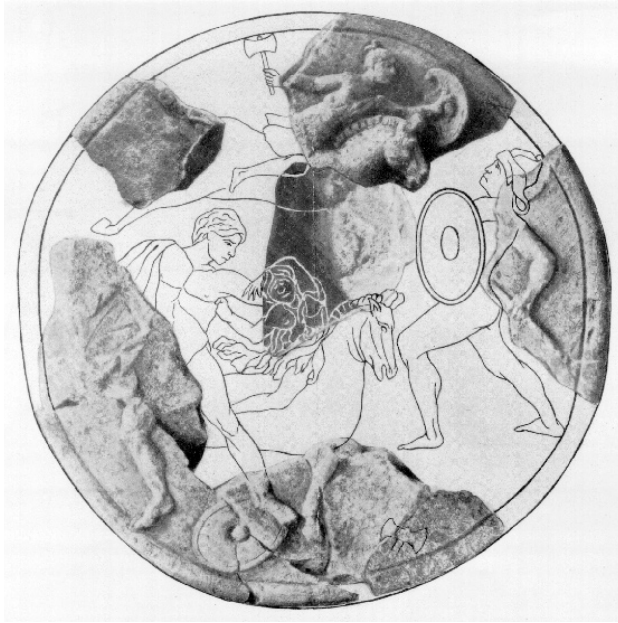
ABB. 1 NASSENFELS, SCHILDAMAZONOMACHIE. REKONSTRUKTION VON F. WAGNER.

Der aus ursprünglich zehn Fragmenten rekonstruierte Schild, Wagner nennt in seinem Katalog sieben Inventarnummern, hatte einen Durchmesser von etwa 35–40 cm, wie sich aus der Krümmung der Randfragmente errechnen lässt. Wagner weist ausdrücklich darauf hin, dass an den erhaltenen Randstücken nirgends eine Hand oder Ansatzspuren einer Hand vorhanden sind, die den Schild gehalten haben könnte. Allerdings fehlen genügend Teile des Randes auch oben, etwa im Bereich der ergänzten Amazonenaxt, um diese Hand zu ergänzen.