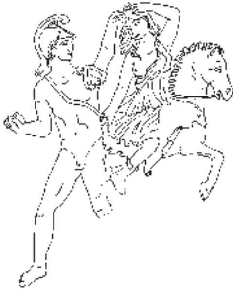
ABB. 3 AMAZONENKAMPFGRUPPE. NACH D. GRASSINGER, DIE MYTHOLOGISCHEN SARKOPHAGE TEIL 1: ACHILL BIS AMAZONEN. DIE ANTIKEN SARKOPHAGRELIEFS XII 1 (BERLIN 1999) ABB. 1 GRUPPE E.