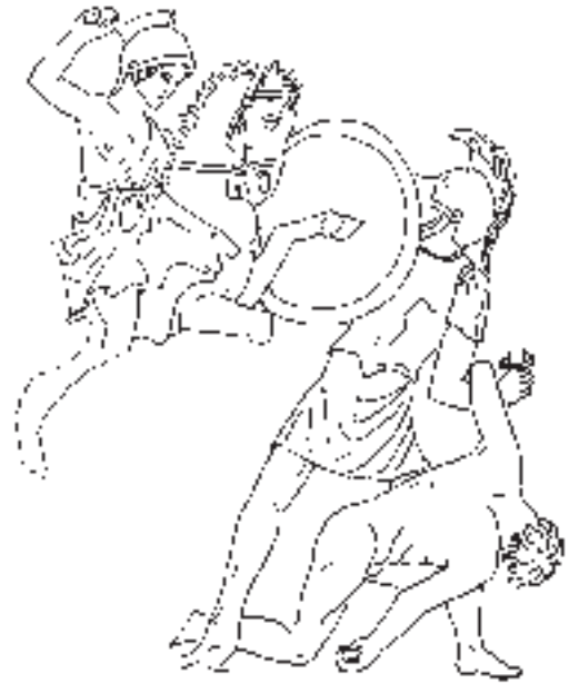
ABB. 4 AMAZONENKAMPFGRUPPE. NACH D. GRASSINGER, DIE MYTHOLOGISCHEN SARKOPHAGE TEIL 1: ACHILL BIS AMAZONEN. DIE ANTIKEN SARKOPHAGRELIEFS XII 1 (BERLIN 1999) ABB. 1 GRUPPE E.

falls am linken Schildrand gesessen haben. Selbst wenn man diese beiden Fragmente bzw. Fragmentgruppen etwas nach oben oder unten schiebt, bleibt kein Platz für den Lanzenschwinger. Auch hier hat also Wagner die richtige Rekonstruktion vorgeschlagen, auch wenn man über viele Details natürlich diskutieren kann.