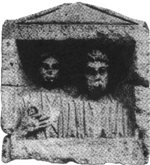
FIG. 5 (RÖMER IN ROMÄNIEN, KÖLN, 1969).