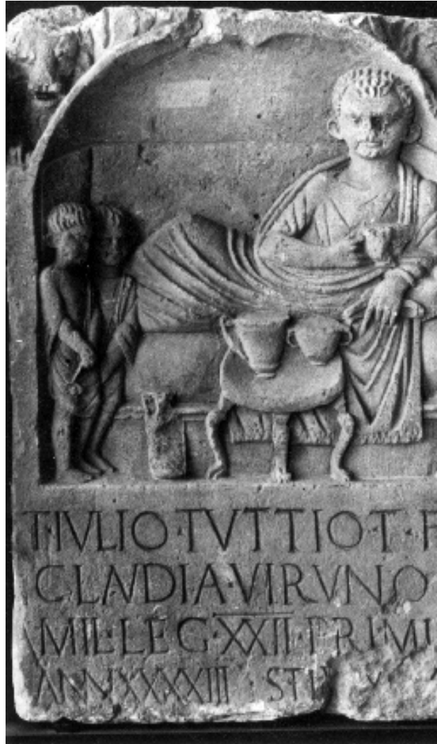
FIG. 1 (E. ESPÉRANDIEU 6466).

Les stèles ornées de personnages debout peuvent être séparées en plusieurs groupes. Toutes se réfèrent,