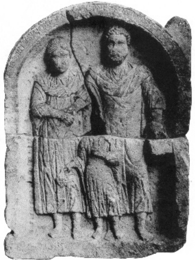
FIG. 2 (MAINZ, CSIR, DEUTSCHLAND, II 5, NO 31).